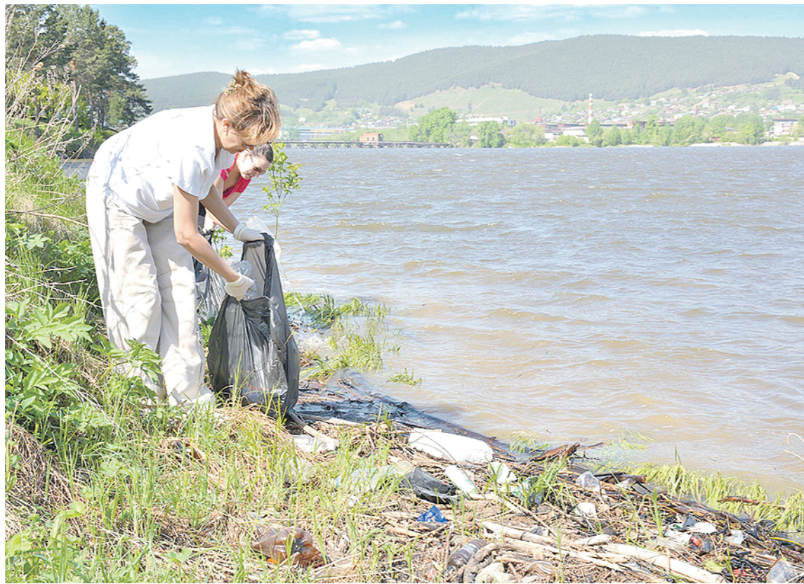
Сохранение здоровья водных артерий — наша общая обязанность.

Прошедший год в Татарстане был объявлен Годом водоохранн зон. Поэтому все, что касается водных объектов, находилось под пристальным вниманием государственных органов, общественности и средств массовой информации. С какими итогами мы вошли в 2017-й, Год экологии и общественных пространств? Каких целей нам нужно достичь? Эти вопросы обсуждались сразу на нескольких мероприятиях профильных министерств и ведомств.