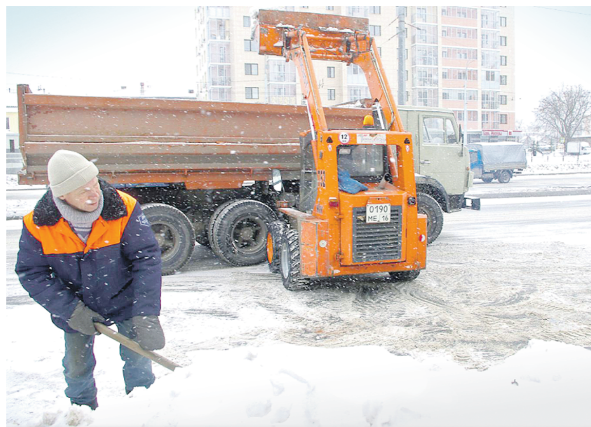
Ирина Демина, «РТ»

Из-за нехватки техники многие населенные пункты республики остаются подолгу засыпанными снегом.