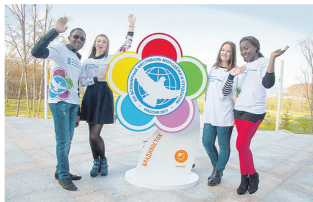
Символом фестивального движения является ромашка.

Форум молодого поколения наша страна принимала уже дважды – в 1957 и 1985 годах. Следующий год станет юбилейным – фестивальному