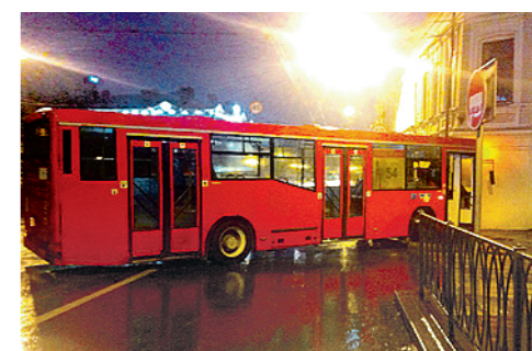
На улице Пушкина в Казани автобус 54-го маршрута въехал в дождь.

ВЧЕРА НА ТАТАРСТАН ОБРУШИЛСЯ ЛЕДЯНОЙ ДОЖДЬ, ЧТО ПРИВЕЛО К МНОГОЧИСЛЕННЫМ СВОЯМ И АВАРИЯМ В РАБОТЕ ТРАНСПОРТА И МНОГОЧИСЛЕННЫМ ПОСТРАДАВШИМ ОТ ГОЛОЛЕДИЦЫ (Ильшат САДЫКОВ). Так, только за три часа в первой половине дня в «скорую помощь» Казани обратились 156 человек, получивших повреждения при падении. Шквал обращений и в травмпункты города. Из-за обледенения проводов наблюдались перебои в работе трамвайно-троллейбусного парка. Резко возросло количество аварий. В казанском поселке Мирный возле школы №129 в хлебный ларек врезался «КамАЗ». В аварию попала и дорожная техника, призванная бороться с гололедом: в Казани на пересечении улиц Комсомольской и Декабристов в ювет съехал «КамАЗ», еще один грузовик дорожников оказался на боку в Зеленодольском районе. На трассе Оренбург – Казань на выезде из села Сокуры столкнулись две фуры, из-за чего на автодороге образовалась большая пробка. Во всех авариях по случайности никто серьезно не пострадал. Также на казанском вокзале были задержаны на два часа поезда на Москву и Барнаул, несколько часов не работал аэропорт столицы.