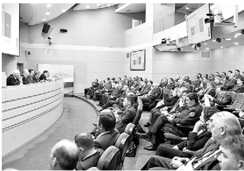
Галимеева Г. / Общественное

Провел совещание в Доме Правительства в режиме видео-конференц-связи со всеми муниципальными районами Президент Рустам Минниханов. По словам министра финансов, бюджет исполнен на 32,6 млрд рублей со снижением к уровню прошлого года на 2,2 млрд рублей, или на 6 процентов. Собственные доходы местных бюджетов мобилизованы практически на уровне прошлого года в сумме 8,6 млрд рублей. Глава Минфина остановился на значимых налогах, по которым наблюдаются определенные проблемы. Так, поступление налога на прибыль за первый квартал составило 12,7 млрд рублей — снижение на 4 млрд рублей, или на 24 процента. Снизил платежи 430 организаций, или 37 процентов от общего количества. Отдельные крупные организации снизили уплату на-