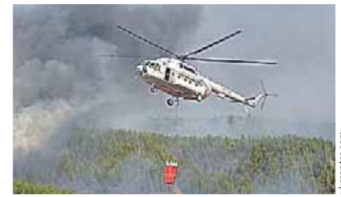
Авиационное звено МЧС Татарстана также активно использует винтокрылы Ми-8МТВ.

КВЗ ПЕРЕДАЛ ТРАНСПОРТНЫЙ ВЕРТОЛЕТ МИ-8МТВ-1 АЛТАЙСКОМУ УЧРЕЖДЕНИЮ «АВИАЛЕСОХРАНА» (Ирина ДЕМИНА, «РТ»).