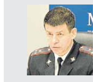
Ильдар САФИУЛЛИН, начальник Управления экономической безопасности и противодействия коррупции МВД по РТ, полковник полиции.

«Наши граждане не учатся на своих ошибках: многие из пострадавших от современных финансовых пирамид еще в прошлом веке потеряли свои кровные в МММ, «Хопер-Инвесте», «Властелине».