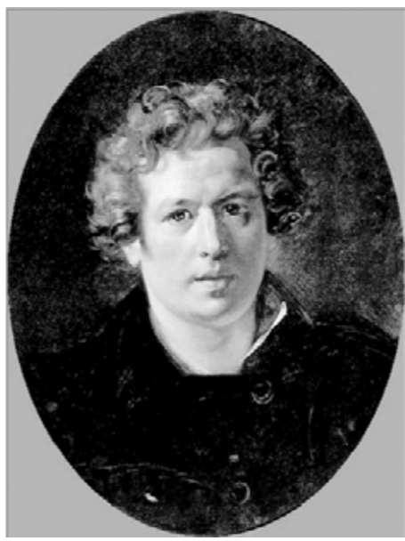
«Автопортрет», 1834 год.