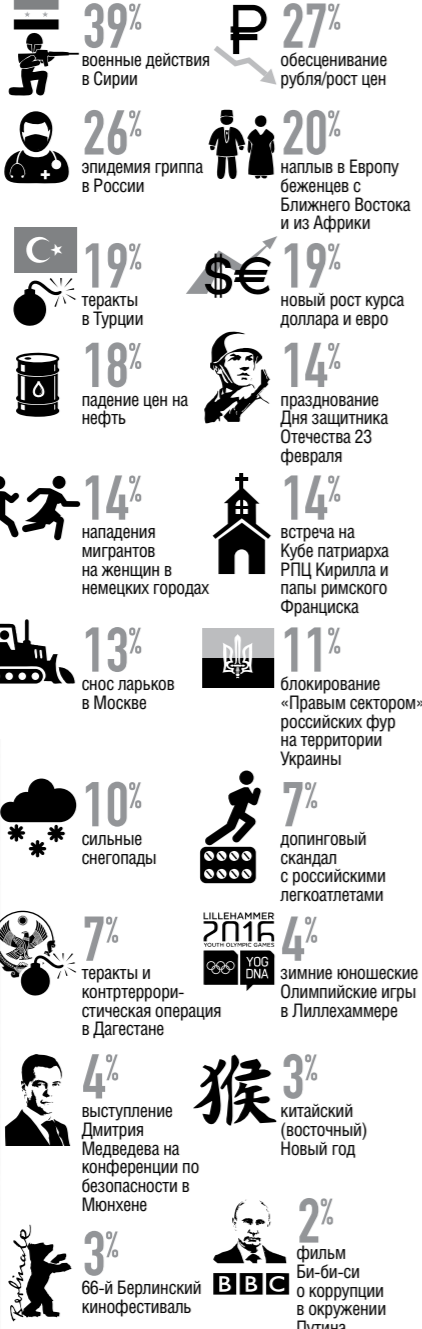
Елси ибел: А! вбелл-анелел оал ол Ё!буу Еабазул

Какие события последних четырех недель запомнились вам более всего? (возможны несколько вариантов ответа, %)