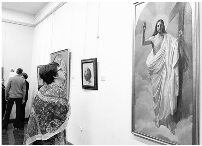
Многие из картин Брюллова впервые покинули Петербург.

Многие из картин Брюллова, которые привезли в Казань, впервые покинули Петербург. Жемчужиной первого зала, безусловно, является «Автопортрет», написанный художником в 1834 году, в расцвете творческих сил. К этому времени уже был написан «Последний день Помпеи», и во взгляде живописца читается не только целеустремленность, но и триумф. Тонкие и