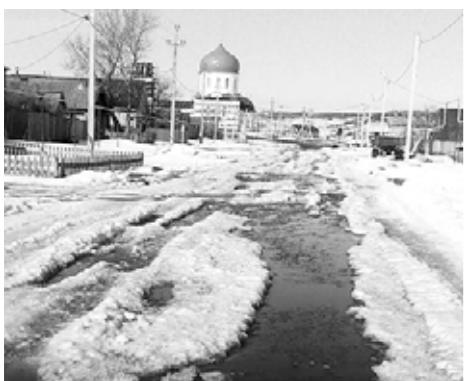
На проезжей части образовалась высокая колея и глубокие ледовые ямы.

С наступлением тепла улицы нашего села Новотроицкого стали напоминать вторую Венецию. Начиная от дома №60 по улице Центральной ни пройти ни проехать – все по колее и в воде. Машины застревают, пешком можно пройти только по сугробам. Затопило и все прилегающие улицы. С этого месяца на проезжей части образовались высокая колея и глубокие ледовые ямы. Во многом причина в том, что дороги зимой в селе от снега не убрались, трактор с грейдером приезжал к нам всего два раза.