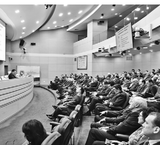
Государственный Совет Республики Татарстан

Закладка памятного камня на месте создания Болгарской исламской академии произойдет 21 мая 2016 года, в День официального принятия ислама Волжской Булгарией, информирует пресс-служба Президента РТ.