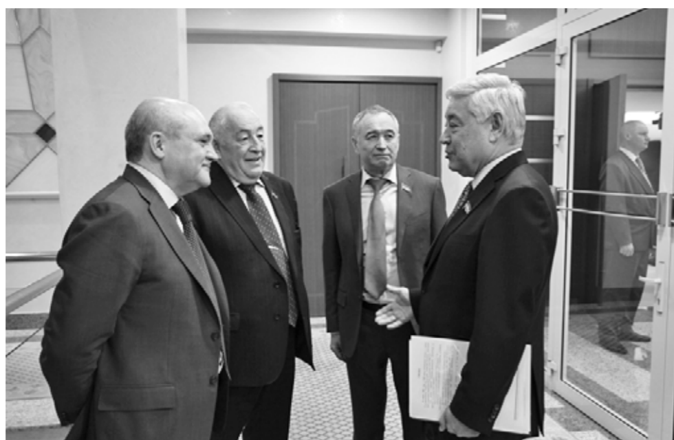
Минниханов Р. Минниханов Р.

Фарид Мухаметшин отметил положительные моменты в деятельности уполномоченного, но в целом его все же не устроил в иных случаях подход к решению проблем. Руководитель столь значимого государственного института самой должностью предписано быть более активным и последовательным в защите интересов детей. Тем более в Татарстане, где всегда повышенным вниманием и заботой со стороны общества пользовались дети и старики. «Если уловили опасную тенденцию, бейте во все колокола, стучитесь во все двери, пишите во все инстанции, обращайтесь к Президенту, в Правительство, в парламент. Будьте настойчивее, используйте все