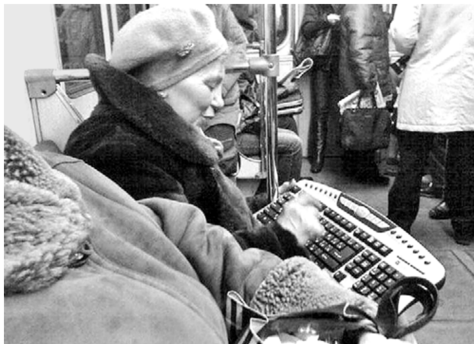
Ноутбуки – для слабаков!

Стою за пивом. Передо мной двое конкретных работяг с соответствующим лексиконом. Беседа – начальник гад, денег не платят и т.п. Матюки через слово. Между делом один заявляет: «А я еще и с бабой своей разлалялся, теперь спим отдельно» (нецензурные вставки опущены). Другой: «А че случилось?» – «Ей больше Цветаева нравится, а мне Ахматова».