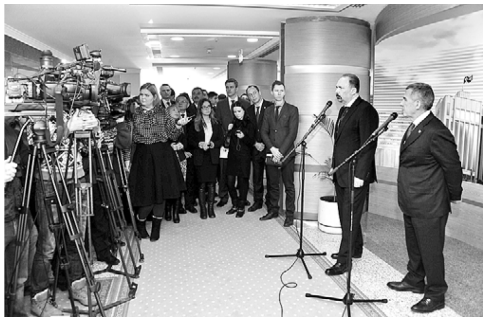
Всероссийское совещание в Казани привлекло внимание многих СМИ, поэтому Президенту Татарстана и федеральному министру пришлось отвечать на самые разные вопросы.

«Вопросы ценообразования важны в любой отрасли экономики, и это не только вопросы справедливости во взаимоотношениях, но и определения возможностей инвестирования», – сказал Рустам Минниханов. – Нам удалось выстроить систему единого заказчика, и в республике все объекты – строительство, ремонт и инфраструктурные проекты – идут через Главное инвестиционно-строительное управление РТ. Та-