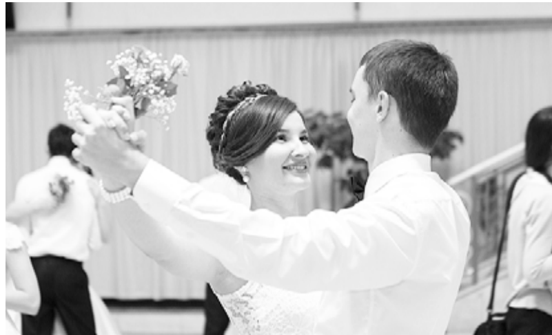
На ежегодном балу в Елабужском институте.

Значительная часть старой Елабуги, по которой сегодня водят туристов, была построена Стахеевыми. А благотворительность была неотъемлемой частью существования купеческого рода. Так, роскошное здание Елабужского института КФУ, где проходили чтения, было построено на средства этих купцов, и в нем было изначально устроено Епархиальное училище. На этот дар городу и гу-