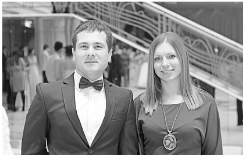
Они не аристократы, аристократы и не аристократы