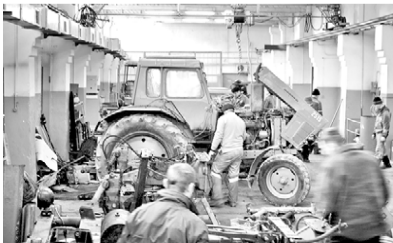
На селе в самом разгаре подготовка к посевной.

– Если фермер планирует приобретение газомоторной техники, то ему целесообразно приобрести и заправочную установку индивидуального типа. Стоит она около 300 тысяч рублей. Крупным сельхозпредприятиям при наличии на их территории сетевого газа подойдут гаражные АГНКС-75 стоимостью от двух миллионов рублей или модульные блочно-контейнерные АГНКС-125 за 30 миллионов рублей. Треования и условия запуска к этим установкам такие же, как и к газовой плите.