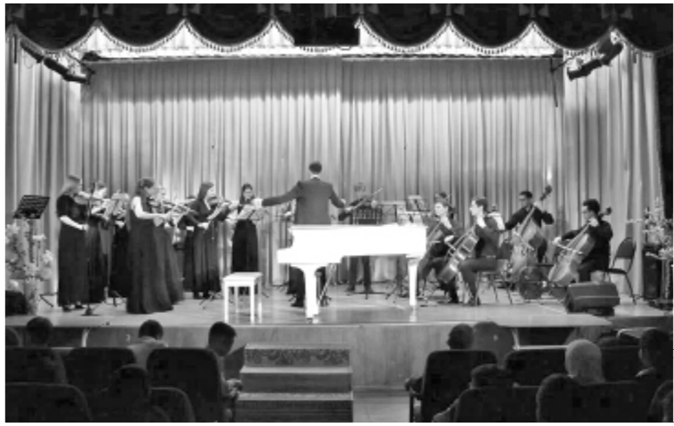
Концерт в культурном центре «Залесный».