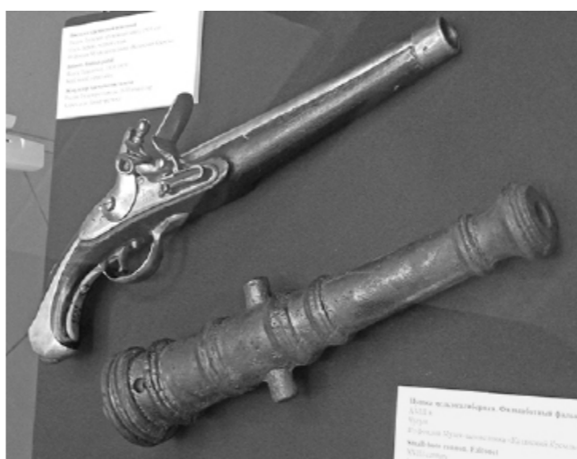
Пистолет кремниевый, пушка малокалиберная.

Экспозиция представлена в музее-краеведческом музее им. Д.Г.Бурлыгина. Уникальные выставки не только в раритетности экспонатов, но и в самой возможности для казанцев и гостей столицы познакомиться с «иногородним» оружием. К сожалению, в связи с недоработками в законодательстве предметы оружейной коллекции в различных регионах могут рассматриваться и как «оружие», и как «предмет культуры». А это существенно затрудняет их транспортировку по стране и экспозицию в иногородних музеях. Так что татарстанцам повезло: до конца сентября мы можем посмотреть эту выставку у себя дома.