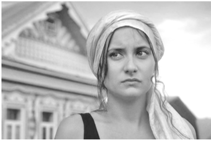
Кадр из фильма «Водяная».

жет не отпустить с первых кадров и до финальных титров, – говорит автор сценария и режиссёр фильма Алексей Барыкин. – Только такие фильмы сегодня имеют шанс выйти в федеральный и международный прокат, и мы рады, что нам это удалось. По словам режиссёра, сюжет фильма местами смешной, местами страшноватый. В гости к родственникам в татарскую деревню приезжает москвичка с двумя детьми. Ночью мать похищает Водяная – ведьма,