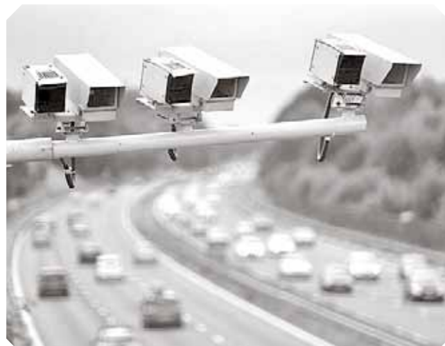
Камеры должны работать на уменьшение дорожно-транспортных происшествий.

Правда, у этого проекта есть одно «но». Разработкой проектов занимаются местные власти. ГИБДД имеет только совещательный голос. Поэтому новый проект усложнит задачу установкам камер для заработка, но проблеме вряд ли решит. Если бы у ГИБДД были полномочия, чтобы вернуть тот или иной проект организации дорожного движения, то, может, и ловушек, и опасных мест на дорогах было бы меньше. И задача у камер была бы отнюдь не коммерческая.